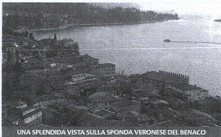
UNA SPLENDIDA VISTA SULLA SPONDA VERONESE DEL BENACO